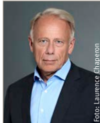
Jürgen Trittin (MdB | Bündnis 90/ Die Grünen)