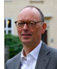
Botschafter Ekkehard Brose (Präsident der Bundes- akademie für Sicherheits- politik)