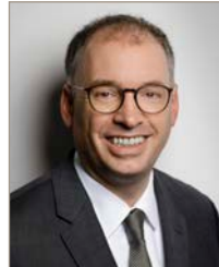
Staatsminister Niels Annen (Auswärtiges Amt | Staatsminister beim Bundesminister des Auswärtigen)