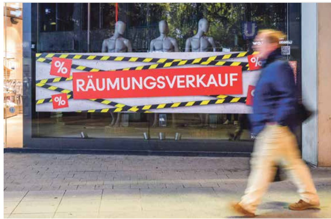
Geschäftsaufgabe: Angesichts der Probleme fehlt der Glaube an eine bessere Zukunft

Diese Summen stehen nicht mehr für den „normalen“ Konsum zur Verfügung, sondern werden ihm zukünftig schmälern. Neben diesen objektiven gesellschaftlichen Restriktionen bestehen subjektiv-individuelle Lebenserfahrungen. In der Weltfinanzkrise 2008/09 wurden die Verluste auf die