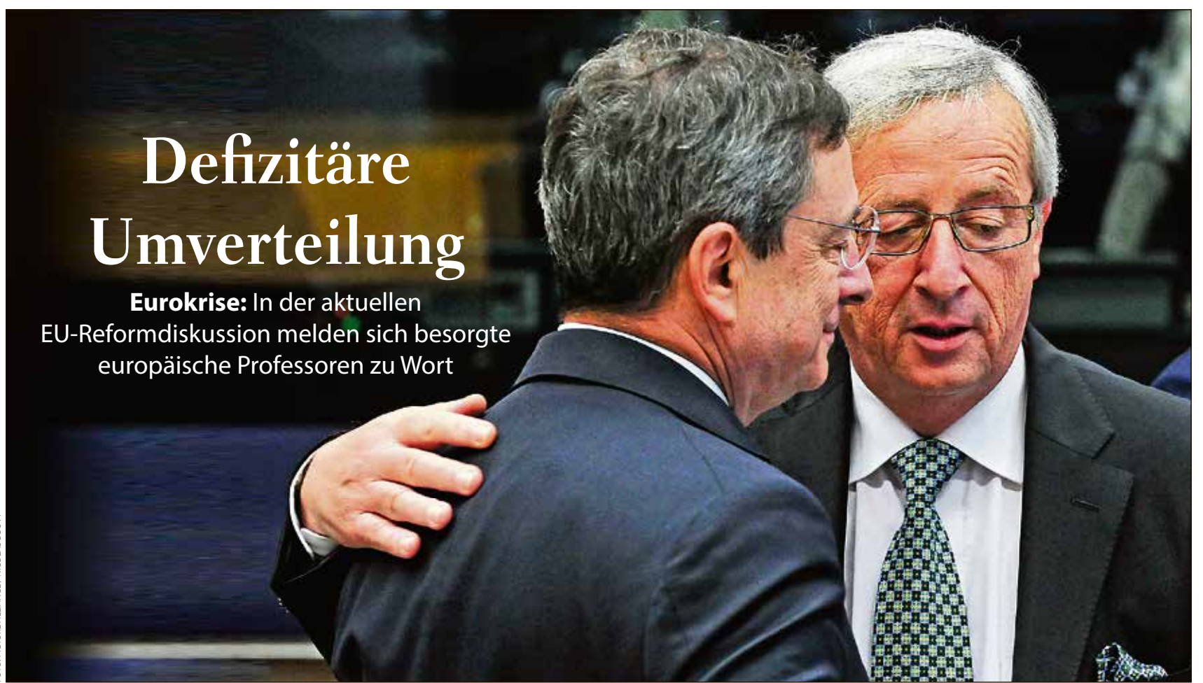
Mario Draghi (l.) und Jean-Claude Juncker: Zukünftig soll ein vom EU-Parlament gewählter EU-Finanzminister die Wirtschaftsregierung lenken

► www.alstom.com/de/germany/ ► www.siemens.de