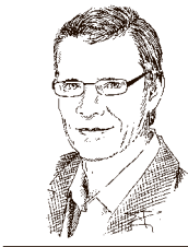
VON DIRK MEYER

Die Banken stehen unter Druck. Seit Juni 2014 erhebt die EZB Strafzinsen auf geparktes Geld – derzeit 0,4 Prozent. Negativzinsen seien Privatkunden allerdings nicht vermittelbar, sagen Banken und Sparkassen. Doch was bei Firmenkunden bereits gängige Praxis ist, wird dennoch diskutiert. Im November 2016 erhoben bundesweit neun Genossenschaftsbanken und Sparkassen Negativzinsen in EZB-Höhe: Pro 10.000 Euro jährlich 40 Euro. Eine andere Methode sind höhere Gebühren bei Tagesgeldkonten, die per Saldo auch zu einer Negativrendite führen. Aber können diese Kosten in der Steuererklärung geltend gemacht werden?