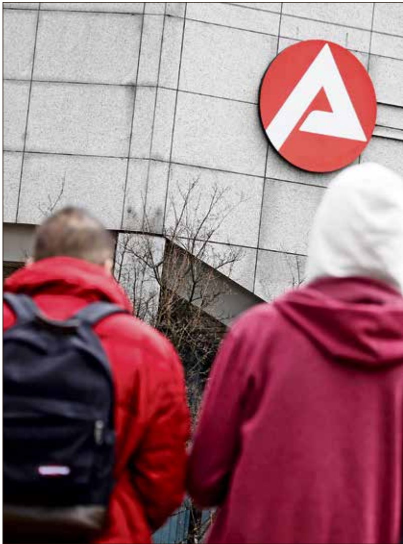
Arbeitssuchende vor Jobcenter: 700.000 Asylanten auf Hartz IV?