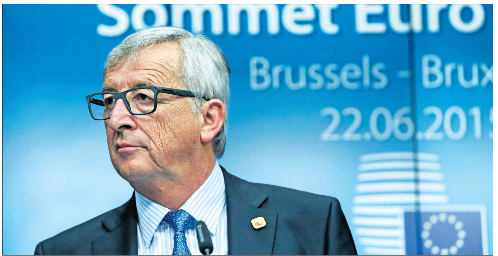
Kommissionspräsident Jean-Claude Juncker: Fordert Eurobonds, eine EU-weite Einlagensicherung, Arbeitslosenversicherung und Steuerhoheit

Technisch gibt es aus heutiger Sicht kaum Abhilfe, ältere Diesel lassen sich nicht einfach per Nachrüst-Kat auf Euro-6-Niveau bringen. Noch ist unklar, welche Ausnahmen und Übergangsregelungen gelten, aber eines ist klar: Mit dem Sonderstatus der Dieselfahrzeuge ist es vorbei. Aber auch Besitzer sparsamer Benzindirektspritzer sollten aufmerksam das blaue „Kleingedruckte“ lesen: Ihre Autos haben ähnliche Probleme mit NO x und Partikeln wie die Diesel.