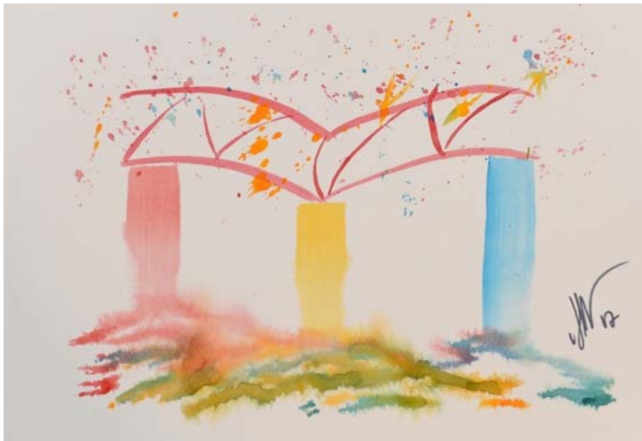
© ZWW 2017, Pilotmodul "Leading Diversity" (LeaD): Diversity an der HSU/UniBw H, Künstler: OTL Michael Hülcher, Foto: Reinhard Scheiblich.